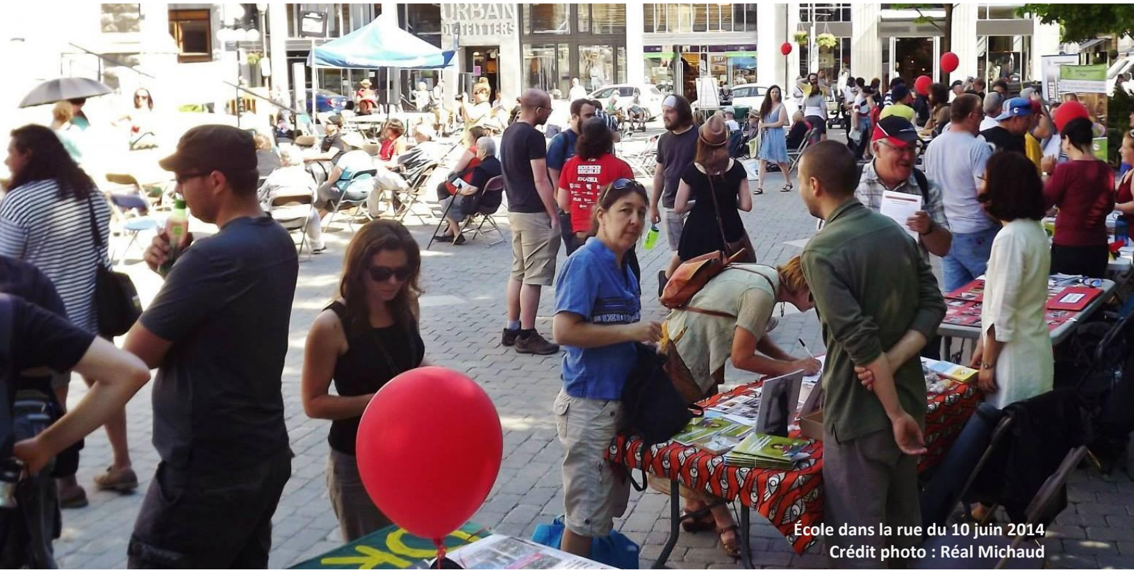
École dans la rue du 10 juin 2014

Regroupement d'éducation populaire en action communautaire des régions de Québec et Chaudière-Appalaches