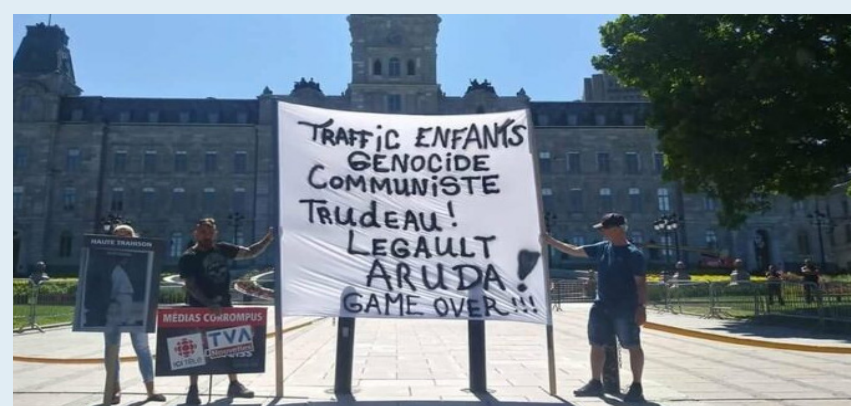
Exemple de message complotiste

L'insécurité causée par la pandémie a créé un terrain fertile pour des groupes en manque de nouvelles adhérent-e-s. C'est ainsi qu'on retrouve, parmi les organisateur-trice-s de ce mouvement, des complotistes et des membres de l'extrême-droite. Ils exploitent la peur et l'insatisfaction générale pour faire avancer leurs théories.